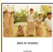
BIEG W WROKU arbeidstog