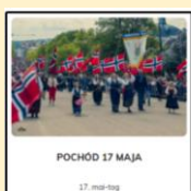
POCHOD 17 MAJA 17. mai-tog